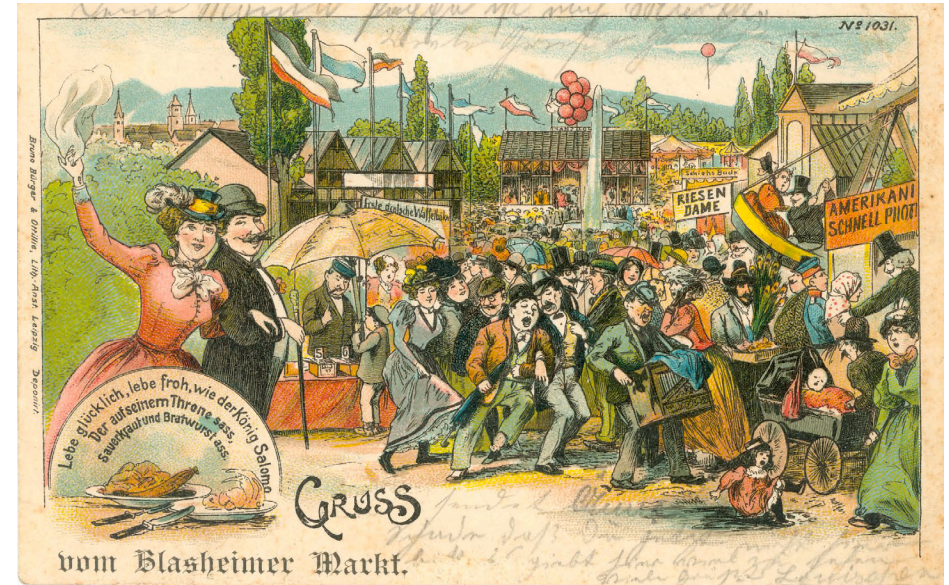
Gruss vom Blasheimer Markt, 1900

Lübbecke tischt auf, Bierbrunnenfest (Mitte August), Blasheimer Markt (Anfang September), Bürgerschützenfest, Wurstmarkt (Ende Oktober), Kinderfest, Abend der Künste, Weihnachtsmarkt, Wochenmarkt.