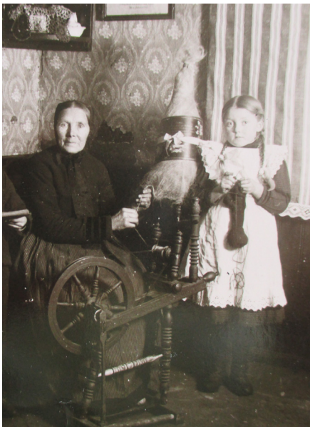
Bauernstube um 1920

Wohnen am Kornspeicher Zwischenstr. 5 32312 Lübbecke Tel.: 0178/1 975 112 kontakt@wohnen-am-kornspeicher.de