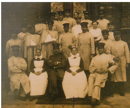
Pflegekräfte Lazarett Lübbecke

Das Engagement der Wohlfahrtsverbände für die ältere Generation hat neben dem Betrieb von Senioreneinrichtungen und –diensten eine gesellschaftspolitische Dimension. Zentrale Aufgabe der Altenarbeit und Altenhilfe ist es, älteren und alten Menschen auch bei zunehmendem Unterstützungsbedarf eine selbstbestimmte Lebensführung und Teilhabe an der Gesellschaft zu ermöglichen.